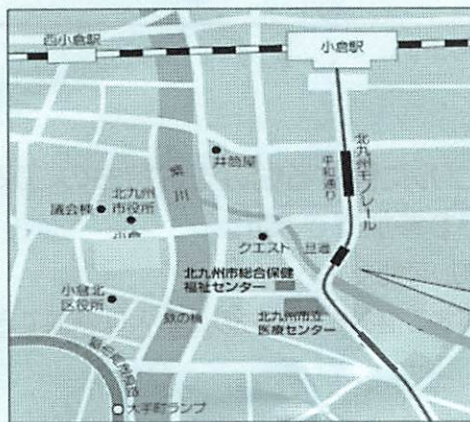
北九州市立総合保健福祉センター 「アシスト21」5階