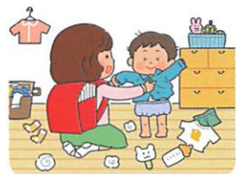
せ わ きょうだいの世話