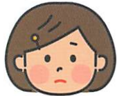
しょうがくせい 小学生Aさん