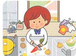
か じ 家事