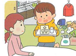
くすり かんり 薬の管理やかんびょう