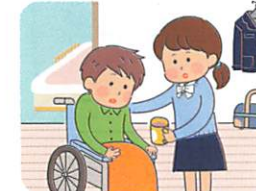
かぞく せ わ しょうがいのある家族の世話