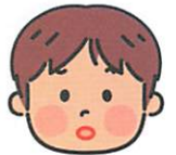
しょうがくせい 小学生Dさん