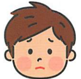
しょうがくせい 小学生Bさん