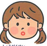
しょうがくせい 小学生Cさん