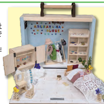
第23回ハートメディア入選作品 油山病院「あぶらやまハウス」