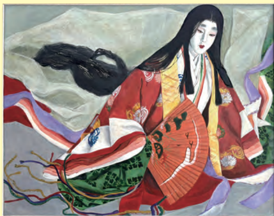
第23回ハートメディア入選作品 地域活動支援センター「ぶらっと」「紫式部」