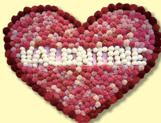
第23回ハートメディア入選作品 河野名島病院「ハッピーバレンタイン」