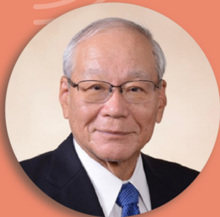
社会医療法人弘恵会ヨコクラ病院 理事長 公益社団法人日本医師会 名誉会長