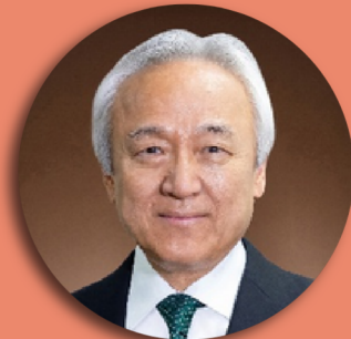
全国都道府県議会 議長会 会長 福岡県議会 議長 世界獣医師会 会長 公益社団法人日本獣医師会 会長 FAVAワンヘルス福岡オフィス 所長